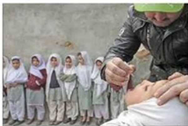
Εμβολιασμός των παιδιών στην εκστρατεία Αποκλειστικής Υγείας (ΕΑΠ) που διοργανώνει η Παγκόσμια Οργάνωση Υγείας.

Από τον χώρο της Πολιομυελίτιδας, είναι η πιο μεγάλη και πιο σημαντική που έχει γίνει ποτέ για την εξάλειψη της νόσου. Η εκστρατεία είναι η πιο μεγάλη και πιο σημαντική που έχει γίνει ποτέ για την εξάλειψη της νόσου. Η εκστρατεία είναι η πιο μεγάλη και πιο σημαντική που έχει γίνει ποτέ για την εξάλειψη της νόσου.