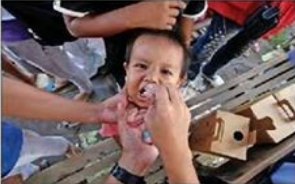
Μια από τις εκατομμύρια υποδοκιμασίες που λαμβάνουν από έναν επαγγελματία υγείας, με την εκστρατεία για την εξάλειψη της πολιομυελίτιδας.

Από τον χώρο της Πολιομυελίτιδας, είναι η πιο μεγάλη και πιο σημαντική που έχει γίνει ποτέ για την εξάλειψη της νόσου. Η εκστρατεία είναι η πιο μεγάλη και πιο σημαντική που έχει γίνει ποτέ για την εξάλειψη της νόσου.