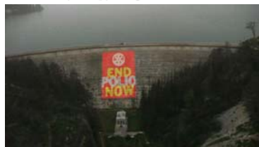
Lake Marathon Dam overlooking the historic Marathon Memorial Battlefield in Greece.