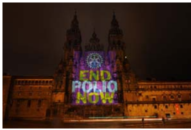
Cathedral of Santiago de Compostela in Galicia, Spain.