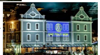
Old Port Captain's Office on the waterfront in Cape Town, South Africa