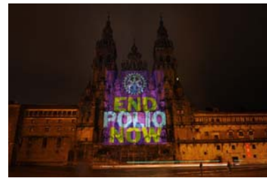
Cathedral of Santiago de Compostela in Galicia, Spain.

Του αρέσει η Μουσική και η φωτογραφία και έχει Προσωπική ιστοσελίδα για φωτογραφίες www.yiannisrousos.com