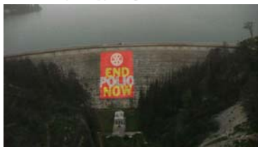
Lake Marathon Dam overlooking the historic Marathon Memorial Battlefield in Greece.

ΓΡΑΦΕΙ Η ANNA-MARIA EYTYXIOY annamariaeytychiou@yahoo.gr