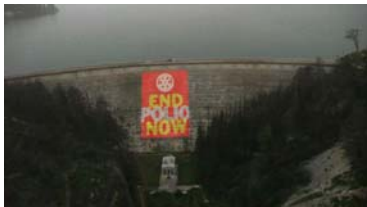
Lake Marathon Dam overlooking the historic Marathon Memorial Battlefield in Greece.