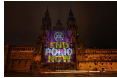
Cathedral of Santiago de Compostela in Galicia, Spain.