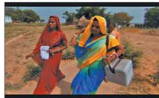
In a scene from The Final Inch , members of an immunization team carry oral polio vaccine to a village in India.

World Polio Day commemorates Jonas Salk, who was born on 28 October and developed the original polio vaccine.