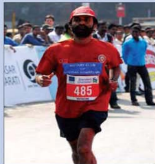
Above, left: British Rotarians raised more than US$28,000 during Purple Pinkie Week.