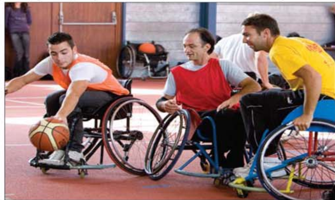
Members of the Interact Club of Lycée Agricole et Horticole Rignac, France, play wheelchair basketball with patients from a nearby facility for disabled people. Sponsored by the Rotary Club of Rodez, Aveyron, in southern France, these Interactors show a clear understanding of the Rotary ideal of Service Above Self by participating in this and other service projects in their community.