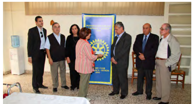
Melathro Dimou 16-11-2009