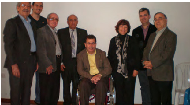
Larnaca Multiple Sclerosis Association 10-1-2010