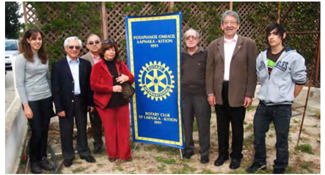
Ayios Georgios Kontos Philanthropic Foundation 27-3-2010