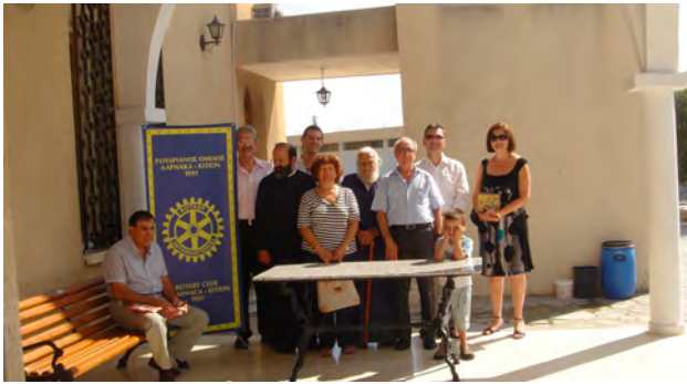
Ayios Ioannis Rossos - 20-9-2009.