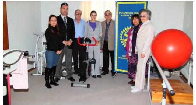
Larnaca Multiple Sclerosis Association 31-3-2010