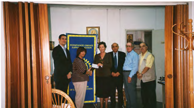
Ayios Ioannis Eleimon 13-11-2009