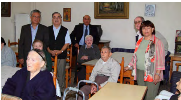
Melathro Dimou 16-11-2009