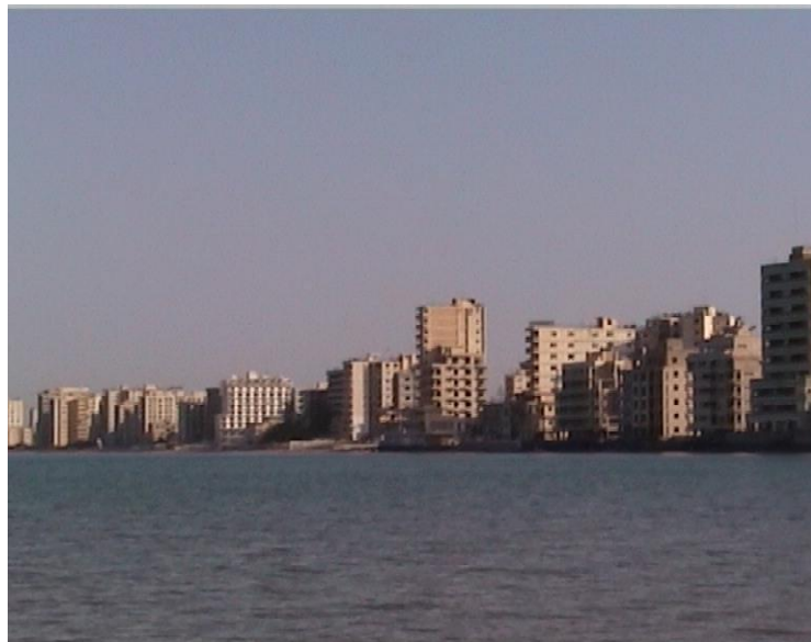
THE GHOST TOWN OF FAMAGUSTA SINCE 1974